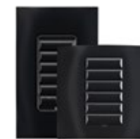
Mitternachtsschwarz (matte Oberfläche)