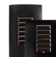
Venezianische Bronze (Metall)

*Braun und Elfenbein sind nicht für 240V Produkte verfügbar.