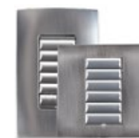
Satin vernickelt (Metall)