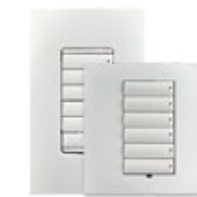
Schneeweiß (matte Oberfläche)